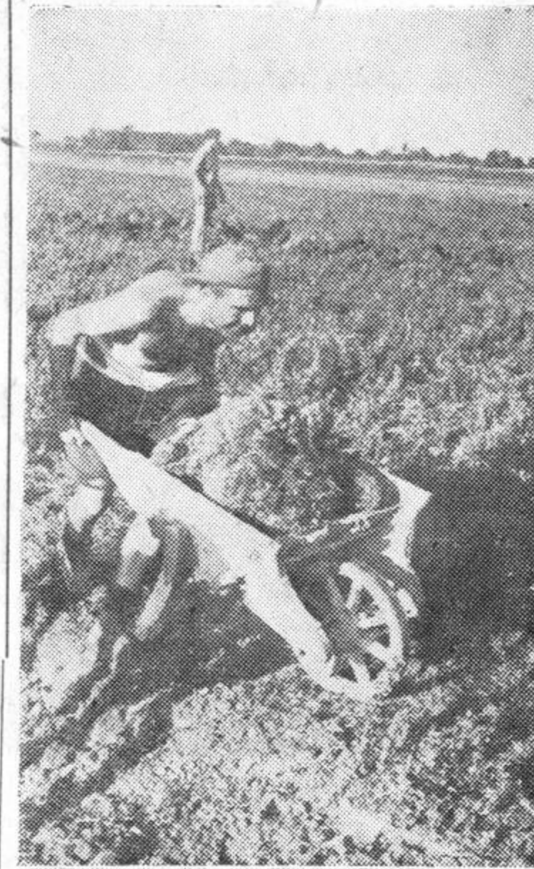
а после на тренинг