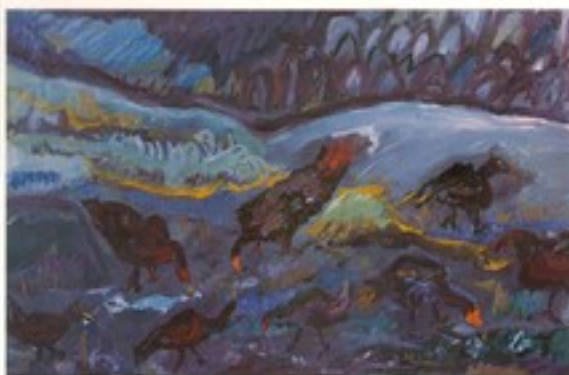
Svetlana Rabić rođena 1965. godine u Sarajevu Magistar likovnih umetnosti samostalni umetnik član ULUS-a Adresa: Obrenovac, Marka Milunovića 17b Radovi: 1. Devored , 1997. suvi pastel, 50x65 2. Veče u kokošinjcu , 1997. ulje na platnu, 60x40